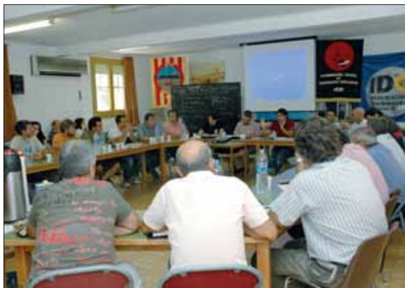
Coordinadora celebrará los 30 años de su actividad en los puertos.

El sindicato está preparando el programa del congreso, al que estarán invitadas “las personalidades más representativas