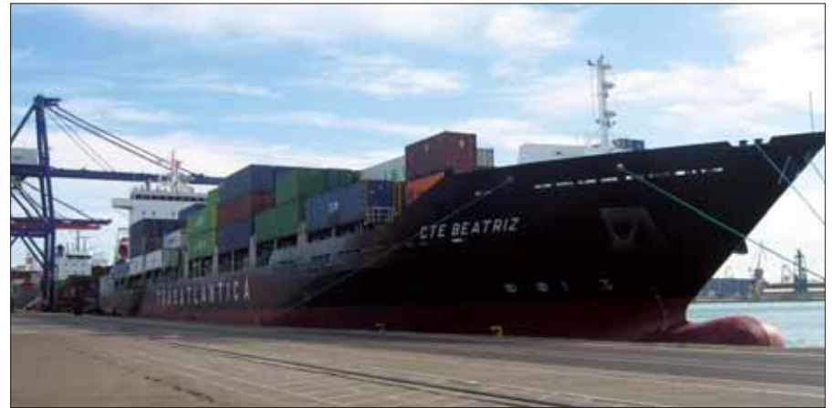
El nuevo servicio express está realizado por los buques “Ruiloba”, “CTE Beatriz”, “Skirner” y “Neuburg”.

Así, las Islas Canarias están actualmente conectadas con la Península e