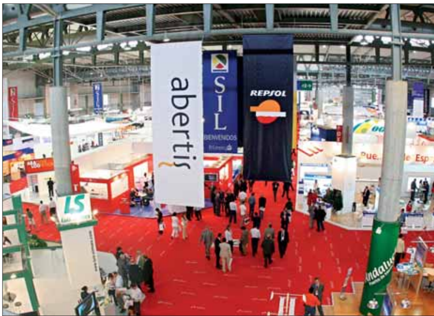
El SIL se ha convertido en un importante punto de encuentro del sector portuario internacional.

El día 4 de junio tendrá lugar la novena Jornada de Logística Portuaria, organizada por Puertos del Estado