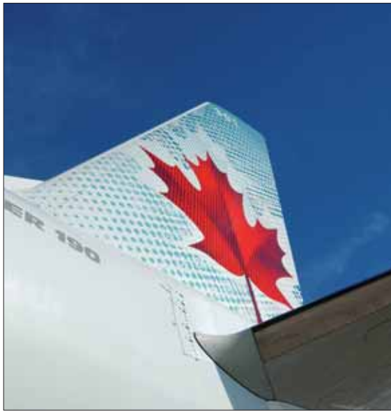
Air Canada sigue apostando por el mercado español.