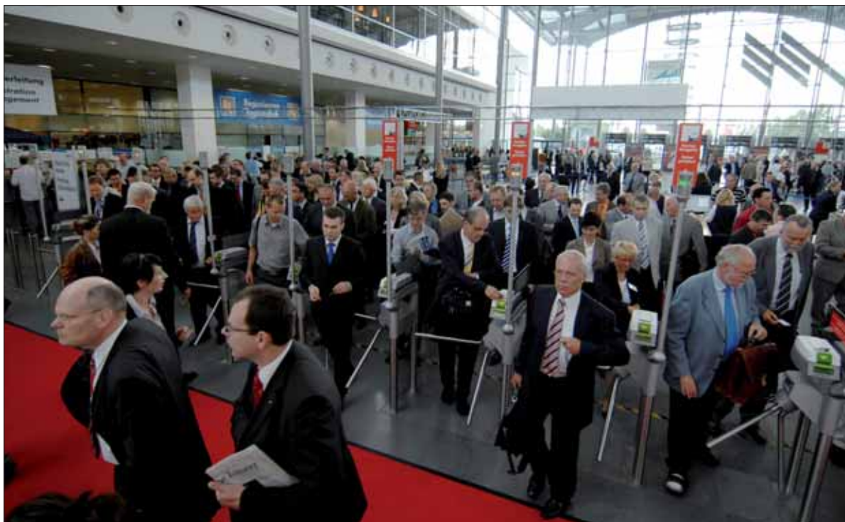
La Feria de Munich tomará el pulso al sector en un momento crítico para el sector de la logística y el transporte.

En este sentido, las empresas y entidades participantes presentarán la más completa oferta de servicios en el campo del transporte de mercancías y la logística, ya que entre los expositores se encuentran operadores de transporte, transitarios, operadores ferroviarios, proveedores de servicios de transporte intermodal, navieras, autoridades portuarias, compañías aéreas y aeropuertos, así como empresas espe-