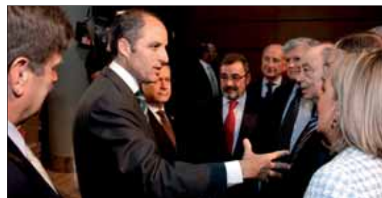
Camps en la presentación del libro “Tecnologías de Futuro para la Comunitat Valenciana”.

La Asociación Nacional de Industriales y Exportadores de Muebles de España (ANIEME) organizó ayer, con el apoyo y la colaboración de ICEX, una jornada de encuentro entre operadores del sector del mueble suizos y fabricantes españoles de mobiliario en la ciudad de Zürich. El objetivo fundamental del encuentro es promover los contactos comerciales.